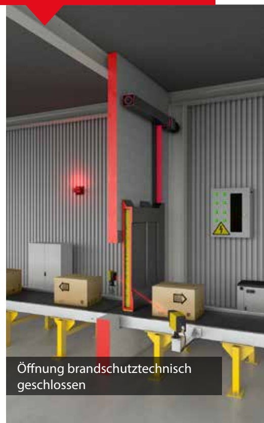
Öffnung brandschutztechnisch geschlossen